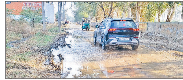
राजौंद। नगर के वीर बागड़ा मार्ग पर गंदा पानी सड़क पर बह रहा।

नगर के वीर बागड़ा मार्ग पर गंदा पानी सड़क पर बह रहा है, जिससे वहां से गुजरने वाले लोगों को भी परेशानी उठानी पड़ रही है। इतना ही नहीं यहां से ज्यादातर लोगों को पैदल ही निकलना पड़ता है। ऐसे में पिछले लंबे समय से पानी की कोई निकासी न होने कारण साया पानी सड़क पर बह रहा है। सड़क भी टूट रही है। इस मार्ग पर पानी निकासी की समुचित व्यवस्था न होने से इस मार्ग के राहगीरों को परेशानी झेलनी