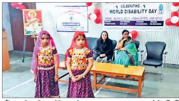
जीद। कार्यक्रम में भाग लेते हुए बच्चे।