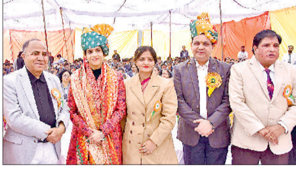
कैथल। डीसी अपराजिता को सम्मानित करते पदाधिकारी।