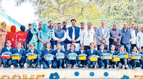
उद्यान। लोधर के पीएम श्री स्कूल में सम्मानित किए गए खिलाड़ी।