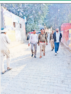
मृतक के शव के पोस्टमार्टम को लेकर कागजी कार्रवाई करने आई पुलिस।

लेबर के भागने पर नुकसान की भरपाई के लिए मुंशी को प्रताड़ित करने का आरोप