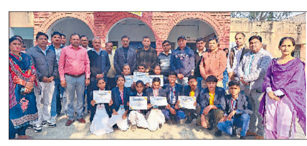
जीद। प्रतियोगिता में विजेता बच्चों को सम्मानित करते हुए।