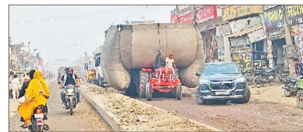
राजौंद। सड़क से गुजरता हुआ ओवरलॉडिंग वाहन न।

पड़ रही है। नगर पालिका प्रशासन इस मार्ग की पानी निकासी की और ध्यान नहीं दे रहा। नागरिक काला, मंजीत, काका, राम सिंह, जयपाल ने बताया कि नालों की सफाई होने के पश्चात भी नालियां, गलियां व सड़क पानी से भरी रहती है। इस