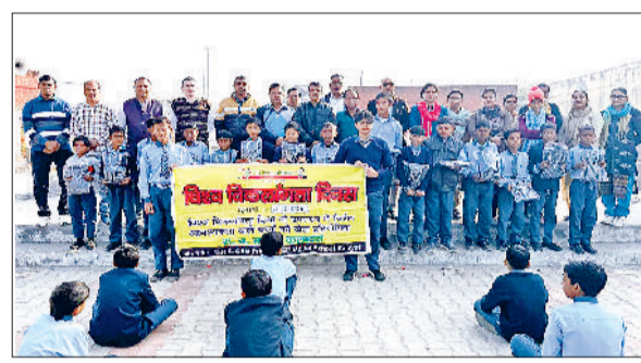
कलायत के सरकारी स्कूल में विद्यार्थियों को गर्भवस्त्र व पाटन सामग्री भेंट करते शिक्षक।