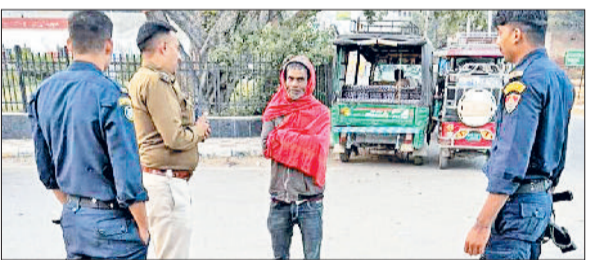
कैथल। ऑपरेशन हॉटस्पॉट डोमिनेशन तहत गश्त करती पुलिस टीम।