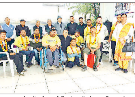
कैथल। नारायण सेवा केंद्र कैथल में दिव्यांगजनों को सम्मानित करते पदाधिकारी।