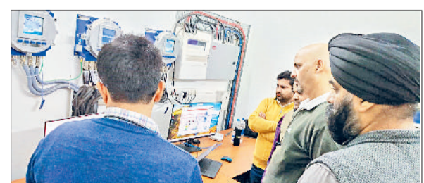
जींद। रेलवे जंक्शन जींद का निरीक्षण करते डीआरएम।