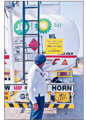
रिप्लेक्टर लगाते ट्रैफिक पुलिस कर्मी।

लाइटें भी लगावाई गई हैं ताकि रात्रि के समय यहां वाहनों की आवाजाही और अधिक सुरक्षित हो सके तथा होने वाली सड़क दुर्घटनाओं को कम किया जा सके। इसी प्रकार मार्गों पर अवैध कटों का भी पता लगा कर बंद करवाया जा रहा है, जो सड़क हादसों के प्रमुख कारणों में से एक माने जाते हैं। धुंध के चलते जींद से छह रेलगाड़ियां रद्द रहेंगी। इसमें से ट्रेन नंबर 54031-