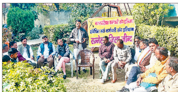
जीद। बैठक में भाग लेते संगठन सदस्य।

स्वदेशी अपनाओ देश को आत्मनिर्भर बनाओ है। उन्होंने कहा कि घरेलू उत्पादों का उपयोग न केवल हमारी अर्थव्यवस्था को मजबूती देता है बल्कि यह स्थानीय कारीगरों, लघु उद्योगों और स्वदेशी उद्यमियों के लिए जीवनरेखा है। यदि देश का हर नागरिक स्वदेशी उपनाने का संकल्प ले तो भारत का आर्थिक भविष्य सुरक्षित होगा और आने वाले समय में हमारा राष्ट्र विश्व गुरु के रूप में फिर से स्थापित होगा। स्वदेशी अपनाए सच्ची राष्ट्र सेवा है। कहा कि अभियान के एक दिवसीय अपनाणा सिर्फ हल खरीदारी नहीं है बल्कि देशभक्ति की सच्ची परिभाषा और राष्ट्र सेवा की एक महान जीवनशैली है।